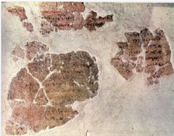
Begyndelsen på den lange tekst, som stod skrevet med blæk på en kalket væg i et hus i Deir 'Alla.