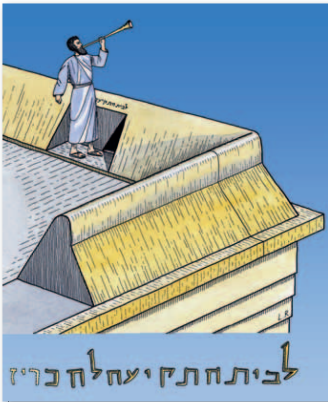
Sådan forestiller en kunstner sig, at det så ud, når præsterne blæste i trompet fra templets tinde. © Leen Ritmeyer.

I alle tilfælde har vi at gøre med et særligt sted. Det sted, hvor præsterne blæste i trompet, når noget skulle annonceres for byens indbyggere.