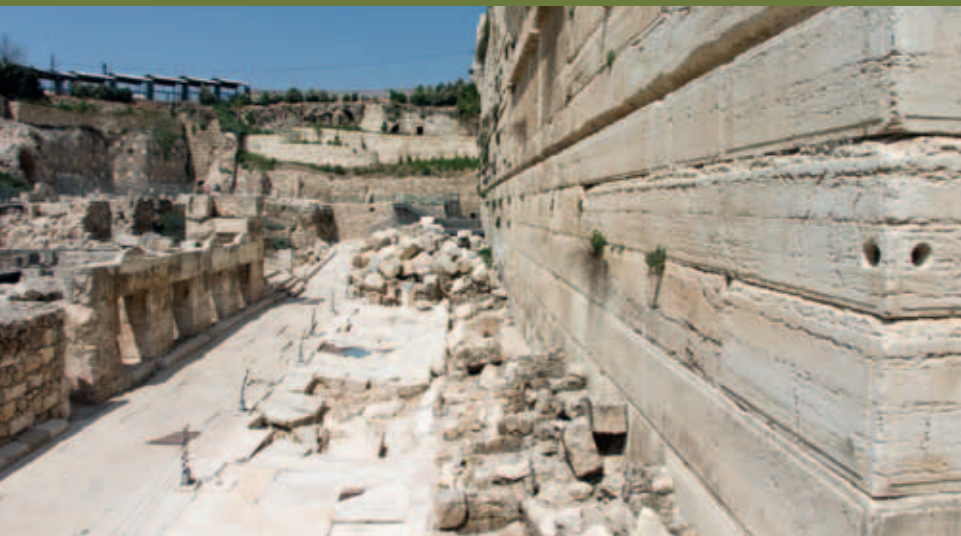
Lag på lag har arkæologer siden 1968 gravet sig ned igennem århundrederne. Ved et besøg i dag går man på Herodes den Stores fortov rundt om tempelmurene og fornemmer, hvor mægtigt et bygningsværk templet var.

ihjel af folkets ledere kort før år 70. Rygterne om Jesu opstandelse havde skabt uro i befolkningen. Jakob blev derfor bedt om at tiltale folket fra templets tinde og skabe ro. Men i stedet styrtede de ham ned.