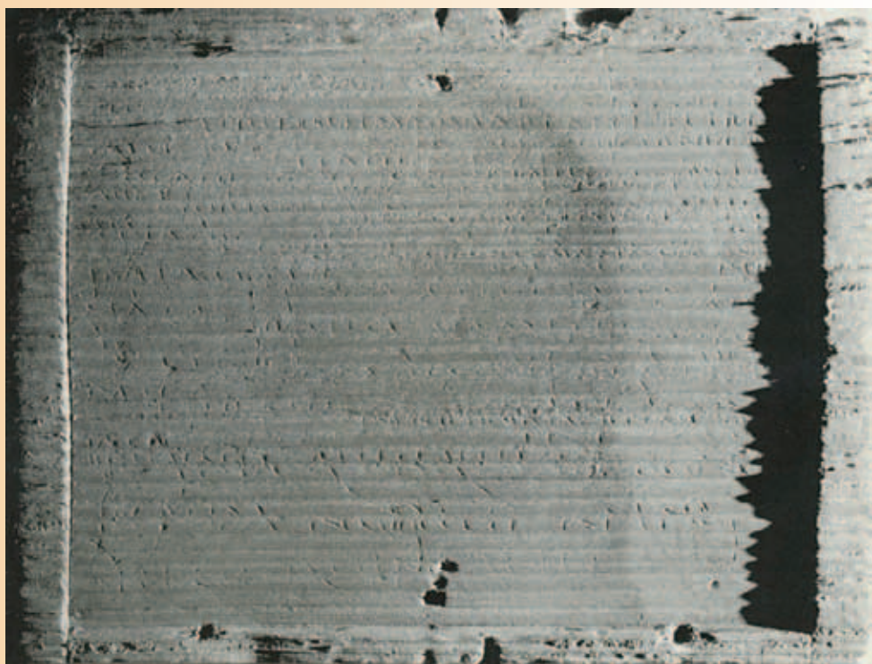
Skrivetavle af træ fra romersk tid, fundet ved Vindolanda i det nordlige England. Fordybningen i midten blev fyldt med voks, hvorefter skriveren kunne skrive i vokset med en spids pen. Skrivetavler blev især brugt til at skrive kontrakter, kvitteringer o. lign. Når der ikke længere var brug for teksten, blev vokset glattet ud, og tavlen kunne bruges igen.

Det samme uvejr gav også arkæologerne dybe panderynker. Uvejret gik særlig hårdt ud over Herodes den Stores gamle havneanlæg i Cæsarea ved Havet. Så voldsomt at de israelske myndigheder har været nødt til at lukke stedet midlertidigt. Lad os håbe, at reparationer kan udbedre de omfattende skader, så et af Herodes' mesterværker ikke går tabt.