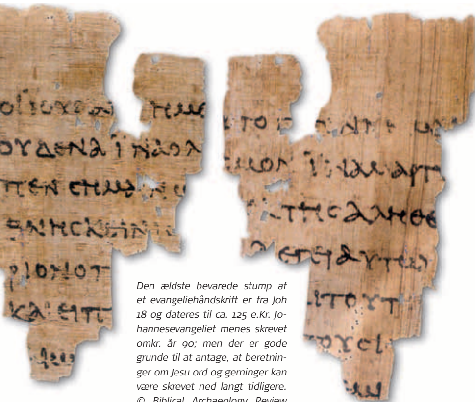
Den ældste bevarede stump af et evangeliehåndskrift er fra Joh 18 og dateres til ca. 125 e.Kr. Johannesevangeliet menes skrevet omkr. år 90; men der er gode grunde til at antage, at beretninger om Jesu ord og gerninger kan være skrevet ned langt tidligere.

spørgsmål – at det skete engang efter år 70 e.Kr., hvor romerne erobrede Jerusalem. En af grundene til denne datering er antagelsen af, at evangeliernes forudsigelser om Jerusalems fald ikke blev fremsat før kort efter, at det var sket.