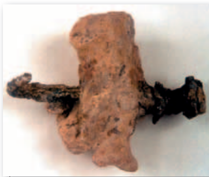
Det var dette syn, der mødte arkæologerne, da de fik børstet støvet af knoglerne i Jehohanans kiste: En hælknogle spiddet af en jernnagle. Hermed var det første fund af en korsfæstet person gjort.