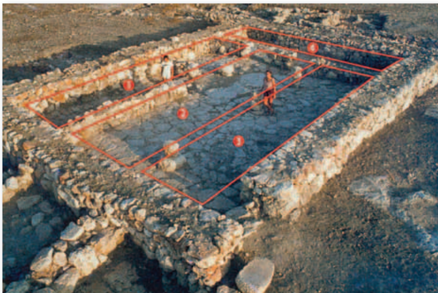
Det såkaldte "firrumshus" bestod af tre aflange rum ved siden af hinanden, adskilt af søjler og mure, og et fjerde rum på langs bagerst. Dette hus stammer fra Izbet Sarta (nordøst for Tel Aviv). Firrumshuset var den foretrukne hustype blandt israelitterne.

På baggrund af Fausts spændende analyser må vi sige, at Israel faktisk kan identificeres ud fra de arkæologiske fund, og at israelitterne opfattede sig som værende anderledes end filistinerne og kana'anæere. De markerede deres særlige identitet ved at undgå at spise svinekød, at holde fast ved en særlig udekoreret og simpel keramik og have en byggestil, som var udtryk for en ideologi om lighed. Dette bekræfter