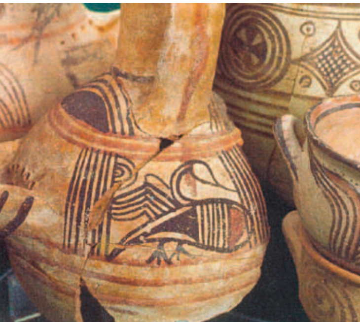
I modsætning til israelitterne havde filistrene rigt dekoreret keramik, med fuglemotiver og geometriske mønstre.

Skyldtes denne enkle og simple keramik, at israelitterne gene-