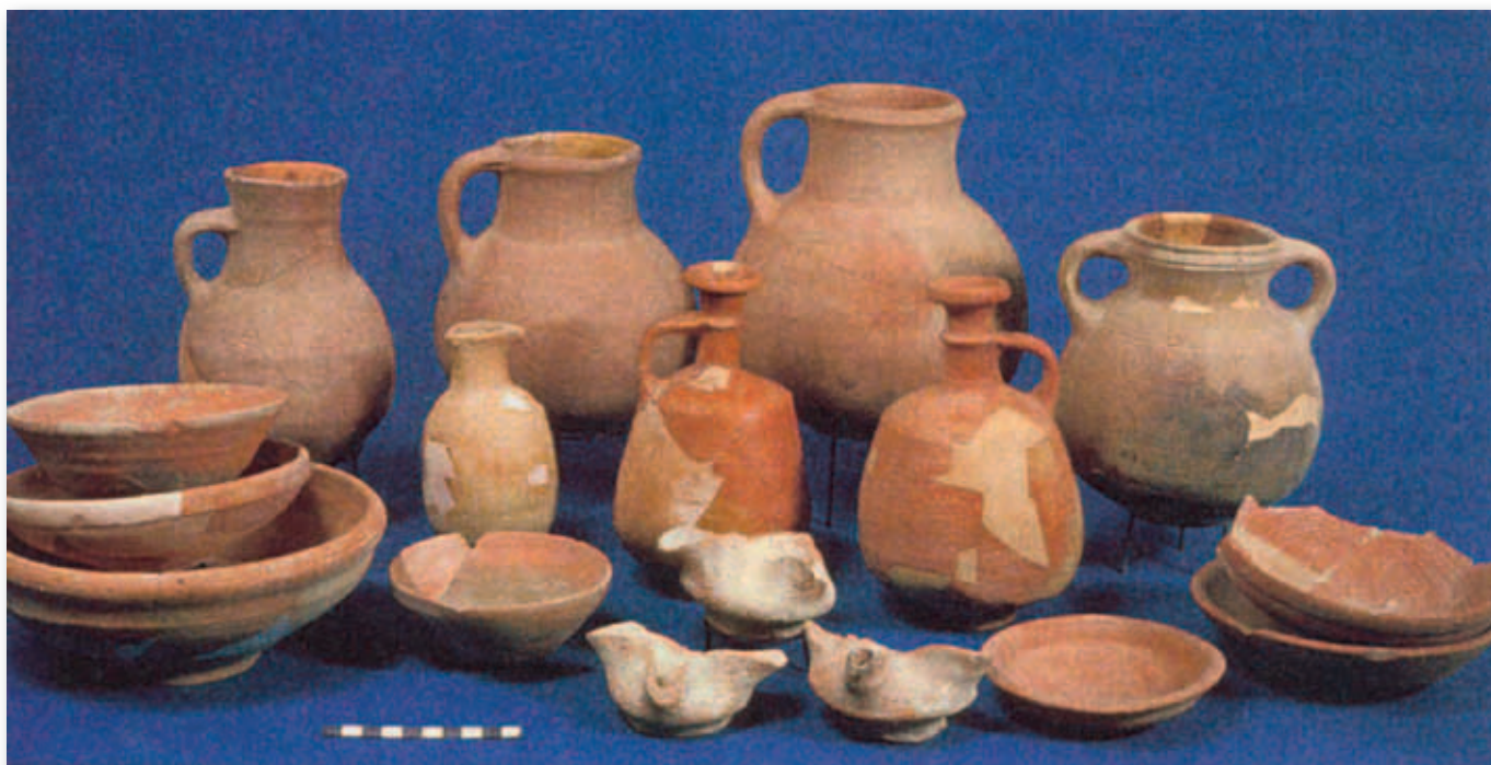
Både i Kongetiden og i Dommertiden foretrak israelitterne at anvende simpel, udekoreret keramik, som dette lertøj fra Jerusalem (8. årh. f.Kr.).

I 2006 udgav Faust en meget spændende bog om Israels tilblivelse som folk, og i 2009 skrev han en mindre artikel til Biblical Archaeology Review om samme emne. Følgende bygger især på denne artikel.