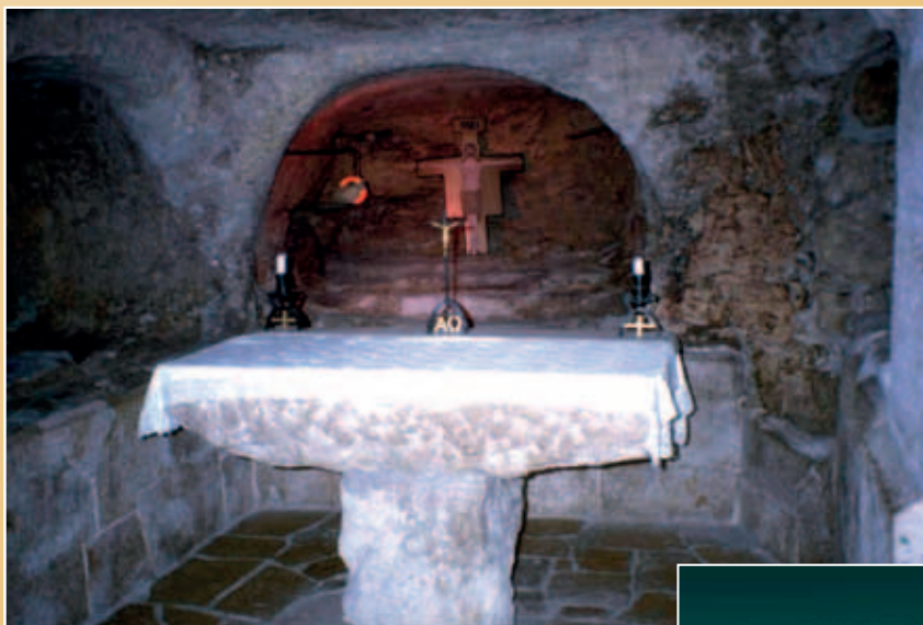
I en af grotterne under Fødselskirken er der indrettet et kapel kaldet "De uskyldige børns Kapel". Bag alteret ses flere barnegrave hugget ud i klippen på et senere tidspunkt for at levendegøre mindet om Herodes' udåd.

Så var der et barnemord i Betlehem? Ud fra en historisk betragtning er det både sandsynligt og svarer godt til vores øvrige kilder til Herodes' liv.