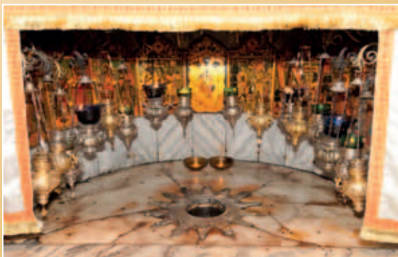
Den mest kendte grotte i Fødselskirken er naturligvis Fødselsgrotten med den berømte sølvstjerne over det sted, hvor Jesus ifølge traditionen blev født. Kirken og traditionen kan spores tilbage til det 4. århundrede.

Man skal passe på med, hvad man sætter teologer til! F.eks. slap den irske munk, Dionysius Exiguus ikke helt godt fra at regne på Jesu fødselsår. Han ramte desværre 6-7 år ved siden af. Ifølge Josefus og andre kilder dør Herodes den Store nemlig ca. år 4 f.Kr. Jesus fødes altså før år 4 f.Kr., og forskellige ting peger på, at vi skal antage år 8/7 f.Kr. som det rigtige årstal. F.eks. peger astronomer på, at der netop det år indtraf en begivenhed på stjernehimlen, som harmonerer godt med omtalen af Betlehemstjernen (Matt 2,2). Se TEL 1998/4.