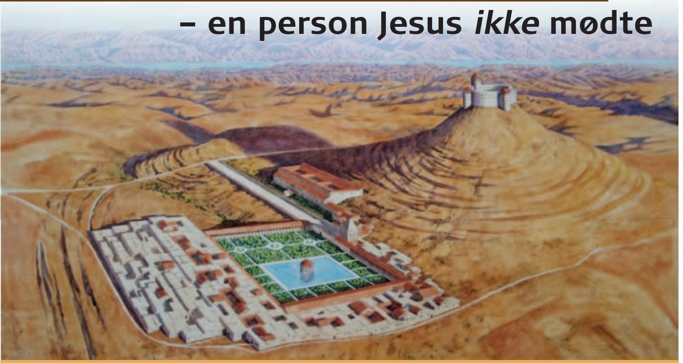
Et bud på, hvordan Herodion to sig ud på Jesu tid. Den store ringborg øverst ydede beskyttelse i krigstid. I fredstid kunne livet nydes i den store swimmingpool med en bar i midten omkranset af haver og søjlegange. Illustration: © archaeologyillustrated.com.

Af Morten Hørning Jensen, ph.d., redaktør af TEL og lektor på Menighedsfakultetet