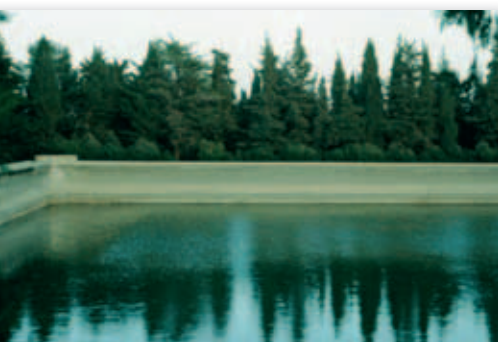
For at mætte behovet for vand på Herodion byggede Herodes en vandledning (akvædukt) fra de naturlige kilder kendt som Salomos Damme ca. 8 km væk.

som Davidssønnen Salomo. Han tilbyder folket at vise sin gudfrygtighed ved at ombygge det tempel, der blev bygget efter hjemkomsten fra Babylon, og som aldrig fik samme skønhed som Salomos (Ezra 3,12; Hagg 2,3).