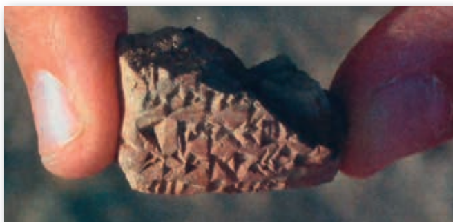
Stump af lovtæst fundet på tel Hasor i Israel i 2010. Den dateres til det 18.-17. årh. f.Kr. og antyder, at den mesopotamiske lovtradition var kendt langt uden for selve Mesopotamien.

28 "Når en okse stanger en mand eller kvinde ihjel, skal oksen stenes, og man må ikke spise dens kød. Oksens ejer skal gå fri af straf. 29 Men hvis oksen tidligere har stanget, og dens ejer ikke har passet på den, skønt han er blevet advaret, og den så stanger en mand eller kvinde ihjel, skal oksen stenes, og også dens ejer skal lide døden. 30 Men hvis det pålægges ham at betale sonepenge, skal han som løsesum for sit liv betale, hvad der bliver pålagt ham. 31 Hvis oksen stanger en dreng eller pige, skal ejeren behandles efter de samme regler. 32 Hvis oksen stanger en træll eller trællkvinde, skal ejeren betale tredive sekel sølv til deres herre, og oksen skal stenes"