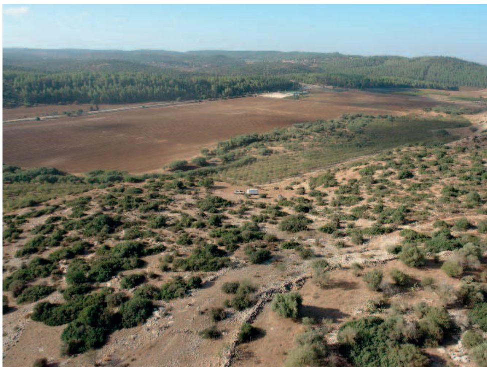
Kh. Qeiyafa ligger som en grænsepost med udsigt over den vigtige vej, der løb gennem Terebintedalen til filisterbyen Gat. Det var i Terebintedalen, at David kæmpede mod Goliat (1 Sam 17,2).

Denne tekst synes at have været en officiel notits af en art, som har indeholdt en befaling i relation til en filisterkonge. Desværre kan vi ikke få sammenhæng i teksten. Men den er et klart vidnesbyrd om, at skrivekunsten var i brug i Israel væsentligt tidligere, end de fleste hidtil har troet.