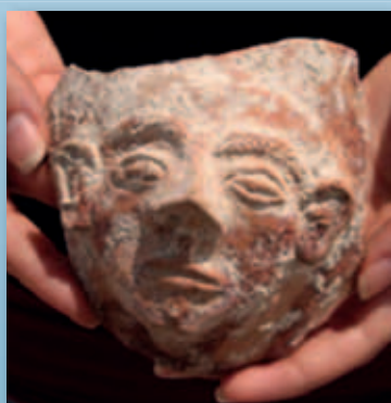
Kvindeansigt fra et kar til drikofre.

De fundne genstande dateres til ca. 1500 f.Kr., 100 år før Israels indvandring. Muligvis er de blevet gemt der, fordi tiderne var urolige, og fremmede hære hærgede i omegnen. Udgraverne gætter selv på, at deponeringen kan have forbindelse med egypternes belejring omkring 1465 f.Kr. af byen Megiddo, 11 km derfra.