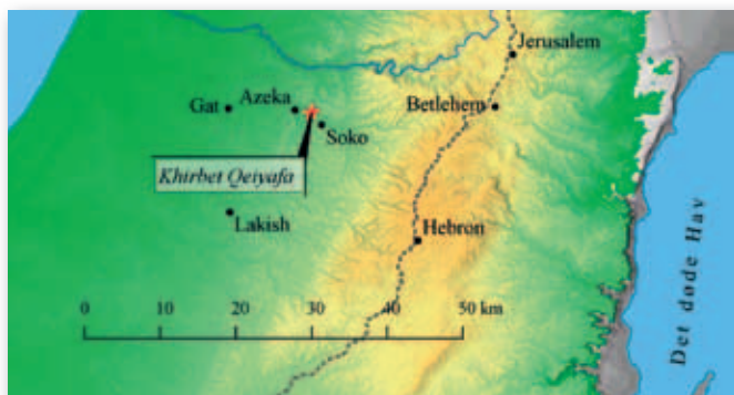
Kh. Qeiyafa ligger strategisk ved udkanten af Juda stammes område.

Hvordan gik det så med udgravningerne i 2009? Kom der nye data frem, som gør, at den sensationelle datering af befæstningen til kong Davids tid alligevel ikke holder stik? Eller kan de seneste fund