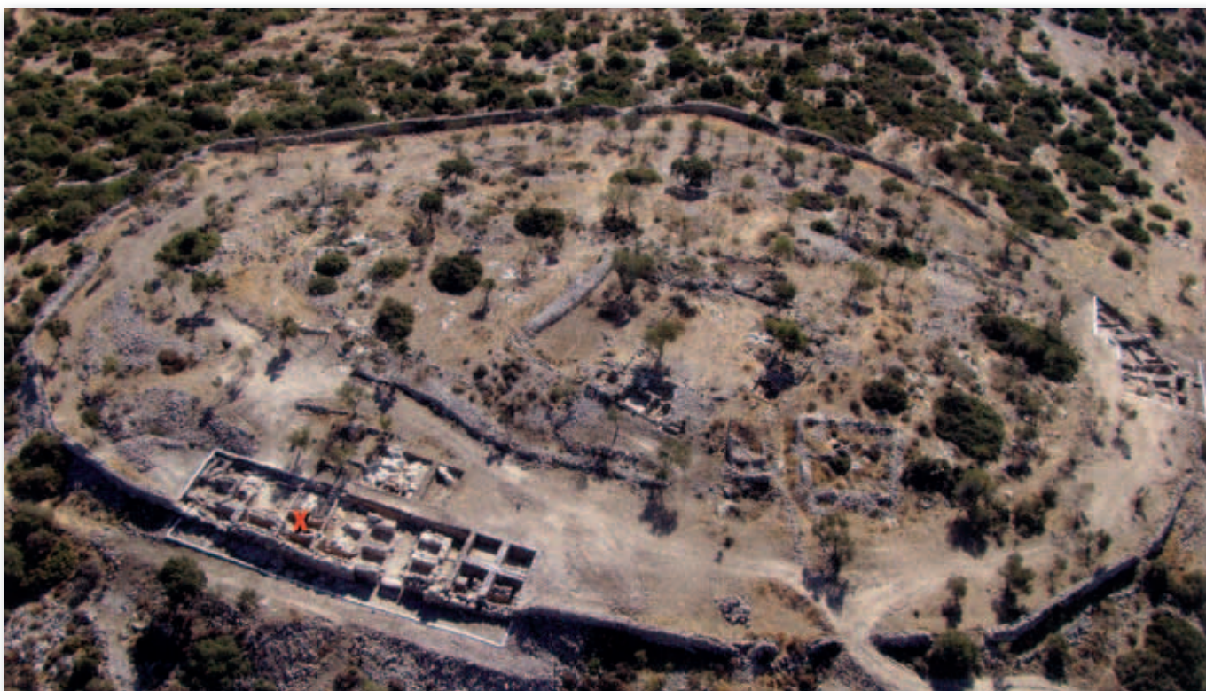
Luftfoto af Kh. Qeiyafa taget mod øst. Nederst i billedet ses vestporten og de afdækkede kasemattrum. Det røde kryds viser, hvor inskriptionen blev fundet i 2008. Til højre (mod syd) anes den nye port, som blev udgravet i 2009.

Den seneste udgravning bekræftede til fulde, at Kh. Qeiyafa kun var beboet i to korte faser, nemlig 30-40 år omkring år 1000 og i tidlig hellenistisk tid (300-250 f.Kr.). Klippen dukker op umiddelbart under den første beboelsesfase. Der er ikke noget før Davids tid.