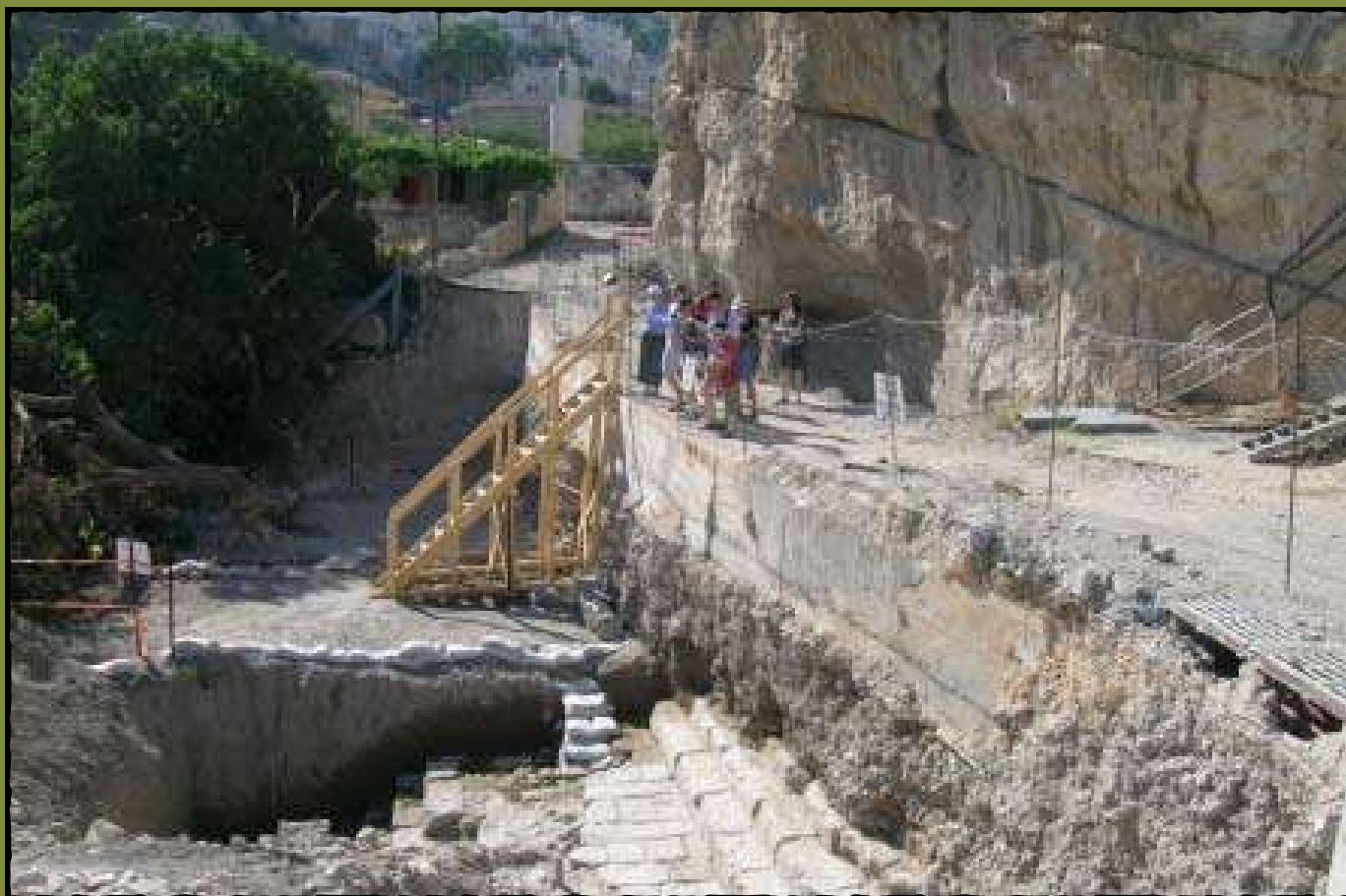
En flok af arkæologerne ovenover den nyudgravede Siloa Dam.