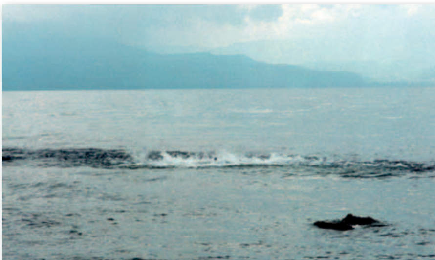
Skummet i vandet skyldes store mængder fisk, der pisker det i oprør. Fotoet er taget en januardag, hvor vandet er koldt og fiskene samles omkring de steder, hvor varme kilder løber ud i søen. En fiskers paradys.

Disse ting lagt sammen – bekostelige både og avancerede fiskerimetoder – gør det tydeligt, at fiskeri ved Genesaret sø på Jesu tid var et stolt og nedarvet erhverv. Så lidt som man på egen hånd havde mulighed for at gøre stenet jord til frugtbar mark, så lidt kunne man på egen hånd kaste sig ud i et fiskerientyr. Det var et familieanliggende, hvor man gennem ➔