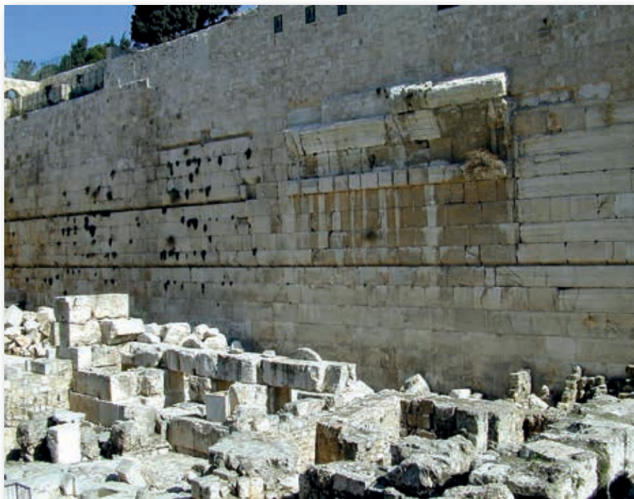
"Robinsons Bue" kaldes denne udvækst på muren, hvor der på Jesu tid gik en bred trappe fra Tempelpladsen ned til hovedstrøget fra Siloa Dam til Damaskusporten. Neden for dette sted, dybt nede i jorden, er det store vandreservoir fra kongetiden blevet fundet.

Men en fremmedarbejder ved navn Ebed-Melek fra Nubien (landet syd for Egypten), der var ansat ved hoffet, hørte, hvad der var sket med profeten. →