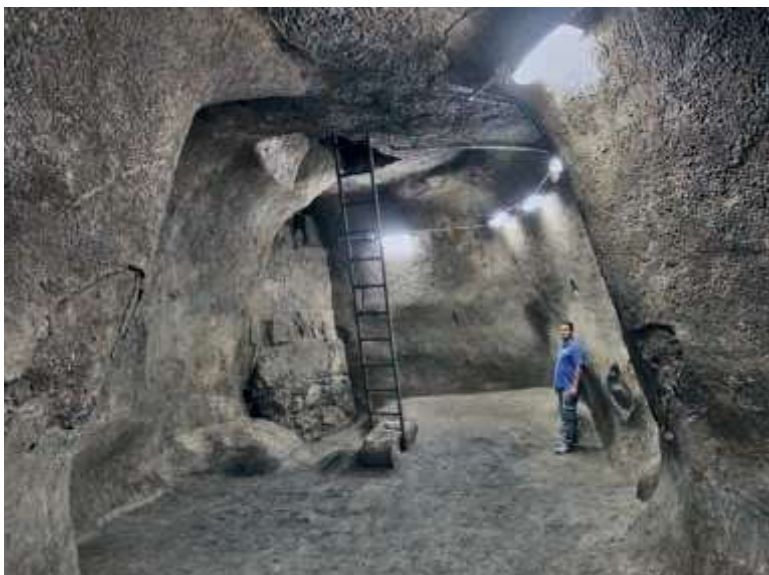
Tomme cisterner blev i kongetiden ofte brugt som et flugtsikkert fængsel. Cisternen er i GT også et billede på den dybeste nød og det tætteste mørke, man kan komme i, f.eks. Sl 40,3.

Resolut tog han affære og fandt nogle slidte klude, som han bandt sammen til et reb, og med hjælp fra 30 personer fik han trukket Jeremias op af cisternen (Jer 38,7-13). Cisternen må have været ganske stor.